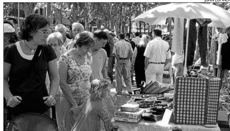
Una de les últimes edicions de la Fira del Cop d'Ull de Banyoles.