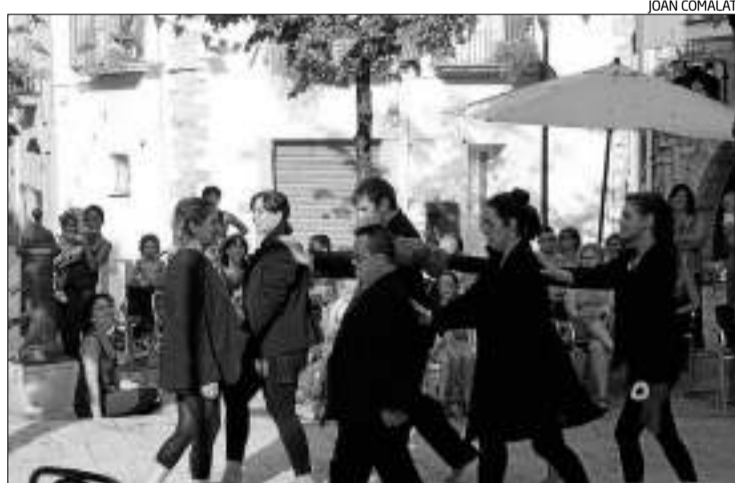
L'avanç de l'espectacle «Ballalavida!» en una festa de barri a Banyoles.

Per aconseguir finançament, el 13 de juny la Fundació Estany va posar en marxa una campanya de micromecenatge a través de la plataforma Verkami que ha permès recollir més de 3.000 euros, destinats íntegrament al projecte de dansa inclusiva Dans Capaci-