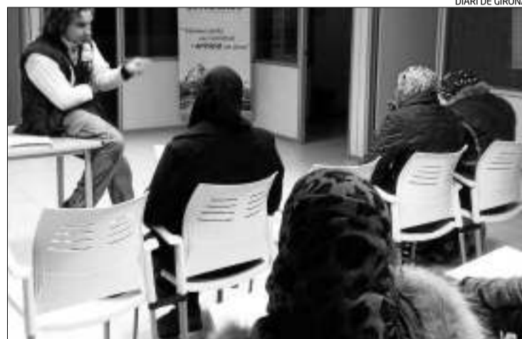
Un grup d'usuaris en una sessió de treball organitzada pel Grup Èxit.