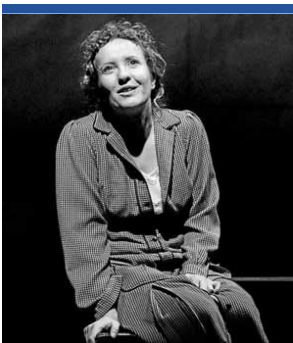
Márquez protagonitza 'Pedra de tartera'

► 00.00. Ball a càrrec del conjunt Sharazan.