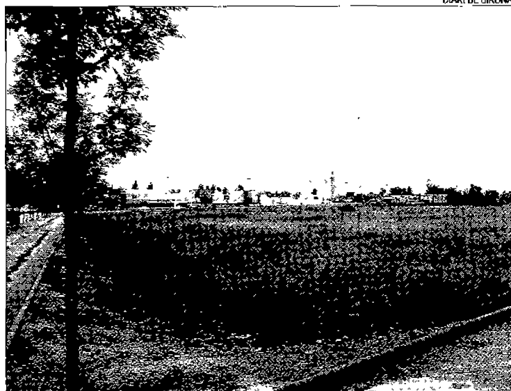
La parcel·la es troba a Vilatenim Sud, a tocar del polígon comercial.

El compromís convergent, però, va durar ben poc i, tot just quatre dies després de les eleccions mu-