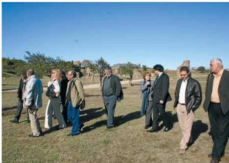
Els alcaldes i alcaldesses que van formar el Terra de Pas, en una imatge del 2009 a la Ciutadella de Roses, on es va presentar el projecte

gelers de la Marenda i president de la Comunitat de municipis Alberes-Costa Vermella, de la qual formen part, -a més d'Argelers- Sant Andreu, Palau del Vidre, Sant Genís de Fontanes, Montesquiú, Vilallonga dels Monts, la Roca d'Albera, Sureda, Cervera, Banyuls de la Marenda, Portvendres i Cotlliure. A l'Alt Empordà els municipis que formen el consorci Terra de Pas són Roses, Cadaqués, Selva de Mar, Llançà, Colera, Portbou, Palau-saverdera, Pau, Pedret i Marzà, Garriguella, Vilamaniscle, Rabós i Vilajuïga. ■