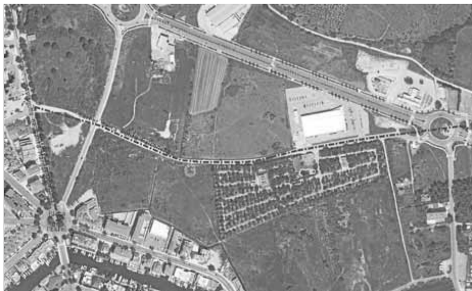
El traçat de 1.024 metres de la canonada actual on s'instal·larà el nou col·lector del carrer de la Punta Falconera i un tram de l'avinguda de Santa Margarida

porta el cabal d'aigües residuals de més de la meitat de la urbanització. El pressupost de l'obra és de 543.719 euros i tindrà el finançament de la Generalitat de Catalunya (120.000 euros a través del PUOSC), Consorci Costa Brava i Fons de Subvencions de la Diputació de Girona (pendents d'aprovar els imports). Un cop s'aprovi el projecte definitivament i es posi a licitació, les obres tindran una durada de quatre mesos i consistiran en la ins-