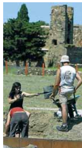
Excavacions a la Ciutadella, l'any 2010