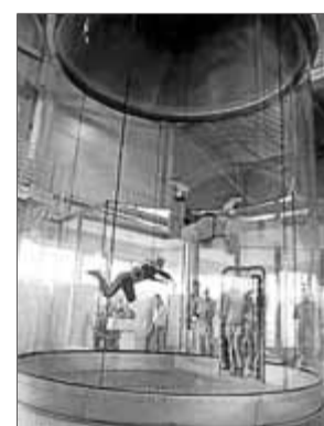
El túnel de vent de Praga ha servit de model ■

La sala de vol del túnel tindrà 4,35 m de diàmetre i podran evolucionar-hi fins a set persones alhora. Segons el director del projecte, serà la segona sala més gran del món d'aquest tipus. L'altra, de les mateixes dimensions, és a Praga i ha servit de model per al túnel d'Empuriabrava.