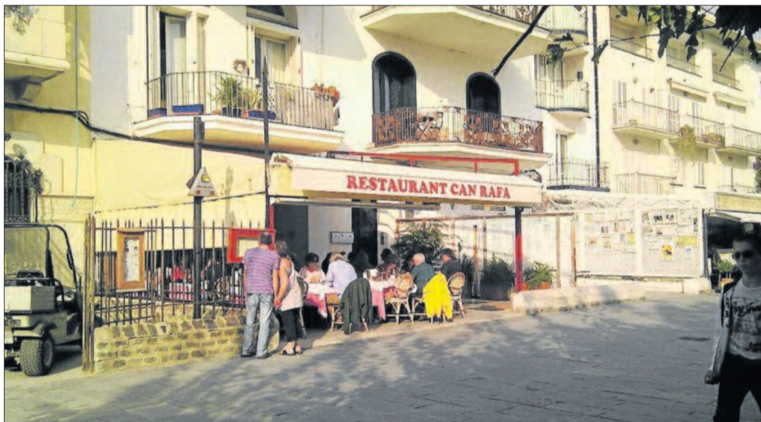
Façana i terrassa de l'establiment.

Tel. 972 15 94 01 - Passeig núm. 7 - 17488 Cadaqués - Cap de Creus