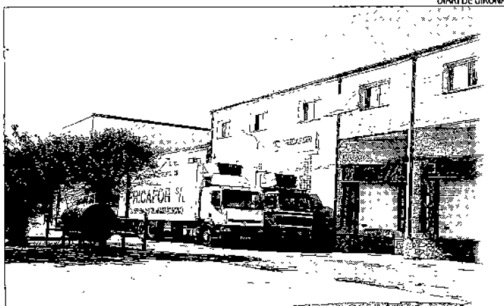
L'escorxador de Fricafor situat a la urbanització de les Forques.

La querrela que ara es presenta és per «un delictes de prevaricació» contra els responsables municipals des del 2004 quan es va tramitar l'ampliació. S'implica els exalcal-