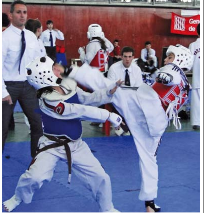
ESPECTACLE. Un dels combats que es van disputar dissabte a Cadaqués