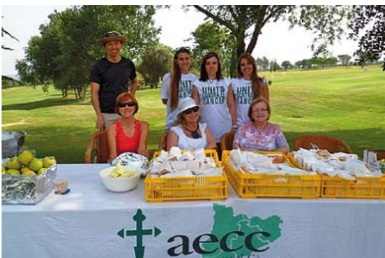
SOLIDARITAT. La jornada va ser tot un èxit amb més de 200 persones