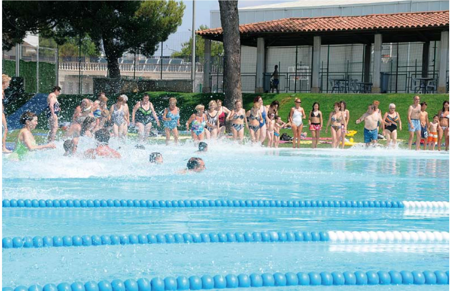
PARTICIPACIÓ. La piscina municipal de Figueres va acollir la iniciativa de la FEM a les seves instal·lacions, on els assistents van mullar-se per la causa

Els participants hauran de nedar uns metres (els que vulguin) a qualsevol hora de la jornada (certificats pels voluntaris i organitzadors) i a continuació rebran un diploma que els acredita com a col·laboradors d'aquesta campanya. Dins de la mateixa activitat,