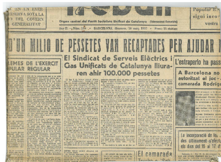
El diari plegat que forma la coberta del llibre

El llibre d'actes de la Mútua Obrera té la curiositat que està embolcallat amb el diari Treball , la publicació del PSUC (Partit Socialista Unificat de Catalunya) del dia 10 de març de 1937. A tall d'anècdota, la secció local del PSUC a Roses es va constituir el 3 de desembre de 1937, amb seu al carrer Galán i Hernández.