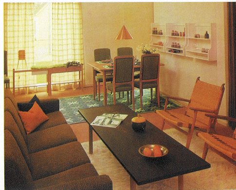
Detall d'un dels pisos de mostra

A l'exterior, els futurs propietaris podrien gaudir d'un gran jardí, un parc infantil i una piscina comunitària, a banda de l'amarrador privat que permetia poder fer qualsevol esport aquàtic. En aquest sentit, el desplegable mostra un home fent esquí aquàtic davant de la promoció en construcció. Un paradís no només per a les vacances, sinó per tot l'any. Els promotors havien condicionat els pisos amb tots els serveis necessaris perquè els caps de setmana de qualsevol mes de l'any poguessin gaudir del Mediterrani.