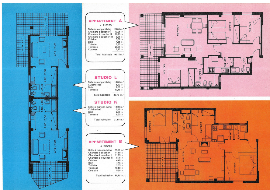
Detall dels plànols d'alguns dels pisos i estudis