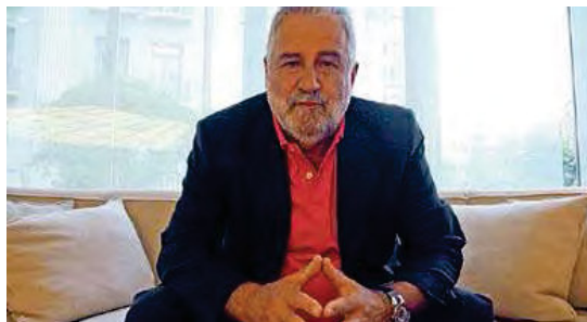
RAFEL NADAL. L'escriptor i periodista gironí.

■ L'Agrupació de Cultura del Casino Menestral Atenea porta divendres, a Figueres, el periodista i escriptor gironí Rafel Nadal, que hi presentarà la seva darrera novel·la La maledicció dels Palmisano , de la qual se n'han venut 200.000 exemplars. Segons va informar fa pocs dies l'editorial Columna, l'obra es traduirà aviat a l'alemany, el francès, l'italià, l'holandès i el polonès. ■