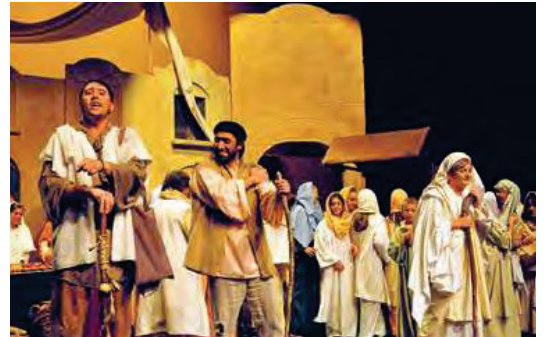
GRUP DE TEATRE DE ROSES. Més de 100 actors pujaran a l'escenari