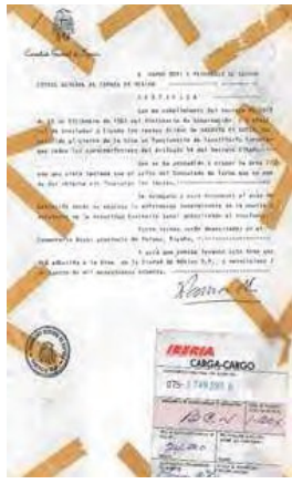
EL DOCUMENT. Del mes HORA NOVA

■ El document administratiu que anava enganxat a l'urna funerària que va transportar les restes mortals del metge i polític August Pi-Sunyer des de Ciutat de Mèxic, on va morir el dia 12 de gener de 1965, fins al cementiri de Roses, és el document del desembre de l'Arxiu Municipal de Roses, que es pot consultar al portal web municipal ( www.roses.cat ). És el document que ha servit per estudiar i analitzar també les conseqüències de la Guerra Civil espanyola de 1936-1939 i el canvi radical, tant personalment com professionalment, que l'exili va significar per a milers de persones. Als gènes exiliats, provinents del món