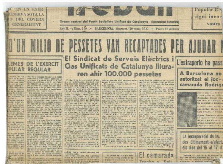
El diari plegat que forma la coberta del llibre

El llibre d'actes de la Mútua Obrera té la curiositat que està embolcallat amb el diari Treball , la publicació del PSUC (Partit Socialista Unificat de Catalunya) del dia 10 de març de 1937. A tall d'anècdota, la secció local del PSUC a Roses es va constituir el 3 de desembre de 1937, amb seu al carrer Galán i Hernández.