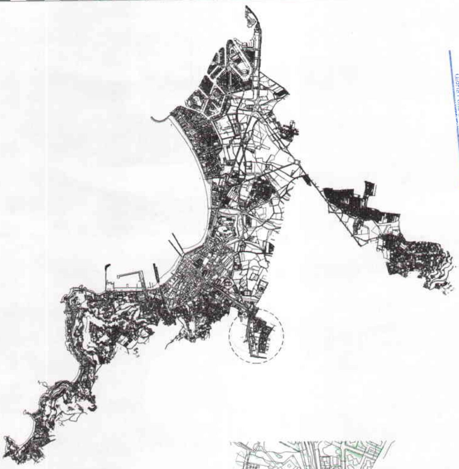
SITUACIÓ ESCALA 1/3500