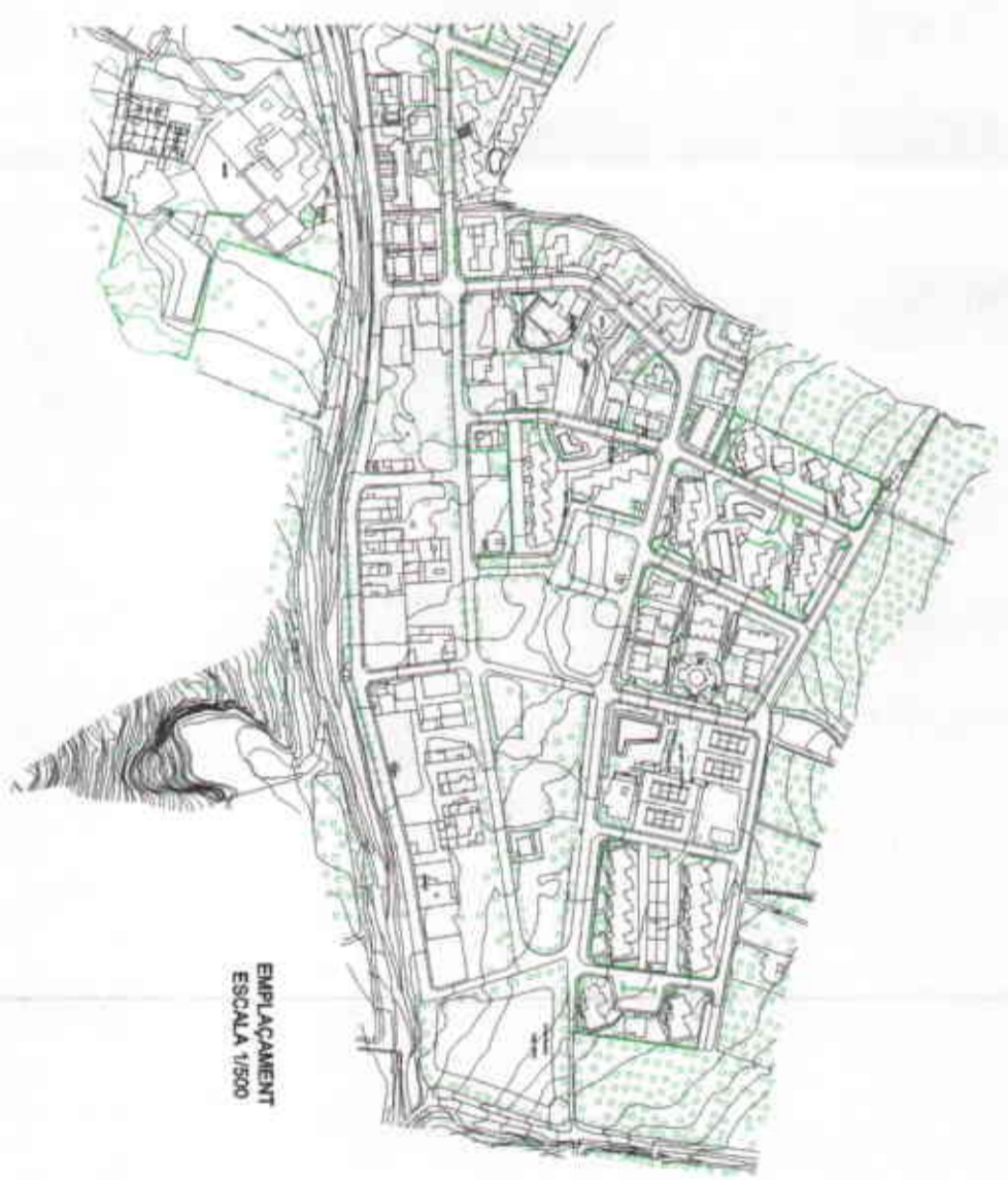
EMPLAÇAMENT ESCALA 1/500