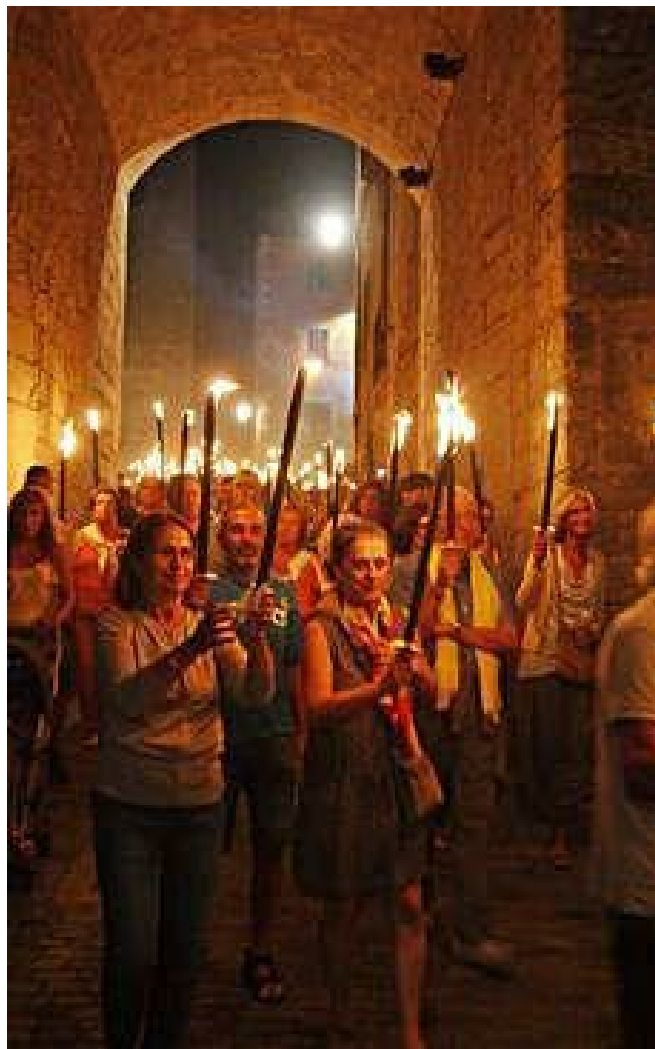
Marxa de torxes a Girona el 10 de setembre de 2018

Per altra banda, el Baix Empordà i el Pla de l'Estany, les dues úniques comarques que el 2018 havien superat la cinquantena de vehicles, amb 54 i 57 respectivament, registren segons el recull d'aquest 2019 els descensos més pronunciats de la comarca. Amb 16 i 20, ompliran menys de la meitat dels autobusos de l'any passat. Els llocs d'origen dels trajectes seran Bellcaire, Calonge-Sant Antoni, Castell-Platja d'Aro, Corçà, Crumosa, Forallac i la Bisbal d'Empordà i Sant Feliu de Guíxols en el cas del Baix Empordà.