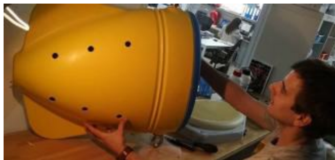
Una boia que engoleix els microplàstics

En un mar cada vegada més plastificat, la neteja de l'aigua està escalant posicions a la llista de prioritats de les institucions i també de les empreses. Aquest és el cas de la companyia GPA Seabots, filial de la multinacional catalana GPA Innova dedicada als acabats metàl·lics, que ha creat una boia que filtra els microplàstics dels mars i oceans.