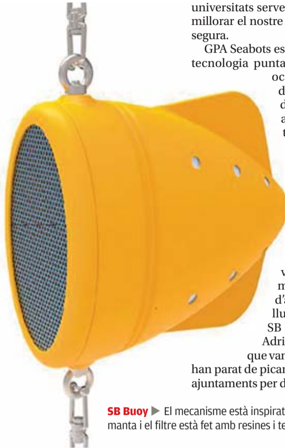
SB Buoy ► El mecanisme està inspirat en el peix manta i el filtre està fet amb resines i teixits naturals.