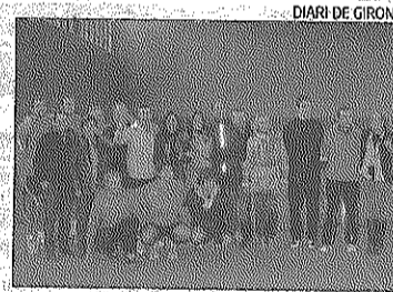
L'expedició del CT Aro a Navarra.

Moltes gràcies a tots per creure en una ràdio pública de qualitat, en català, al servei dels ciutadans d'aquest país