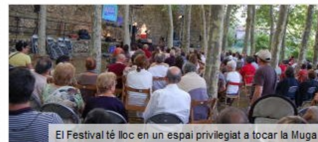
El Festival té lloc en un espai privilegiat a tocar la Muga