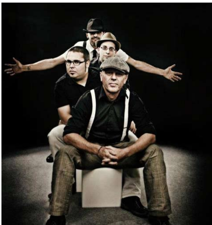
DIRTY JOBS. Versions de rock el dissabte 18 d'agost