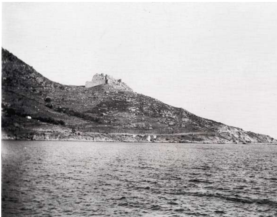
CASTELL DE LA TRINITAT. Una imatge presa a Roses entre el 1920 i el 1930