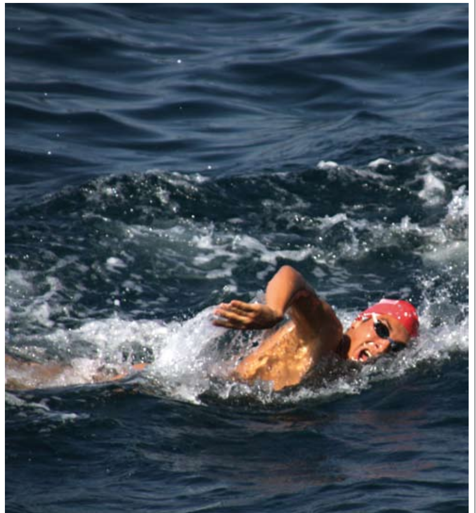
NATACIÓ. Durant la XXVII Travessia es disputarà el Trofeu Enric Badosa

Una forma divertida i saludable de gaudir de la Festa Major de Roses i de l'estiu a la comarca.