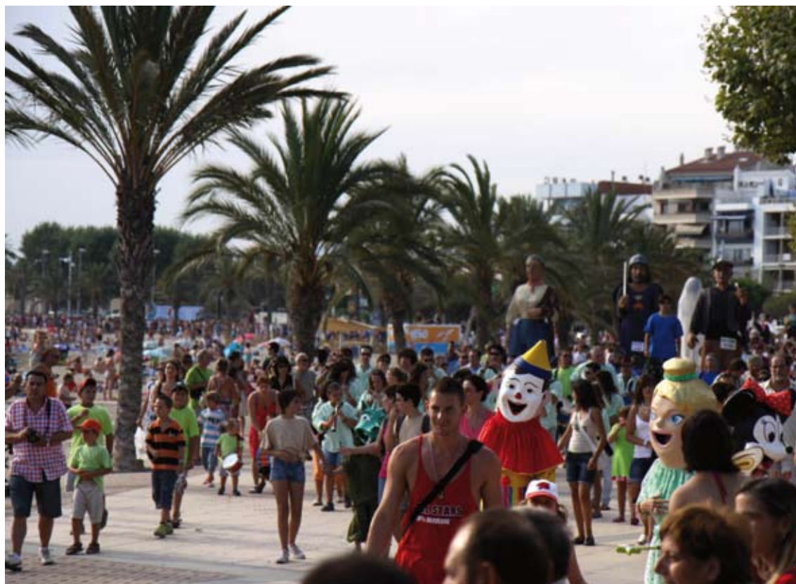
LA CERCAVILA. Un dels actes més populars de tota festa major

Són moltes les opcions que ofereix aquest programa, ja sigui amb la família, amb els amics o de forma individual!