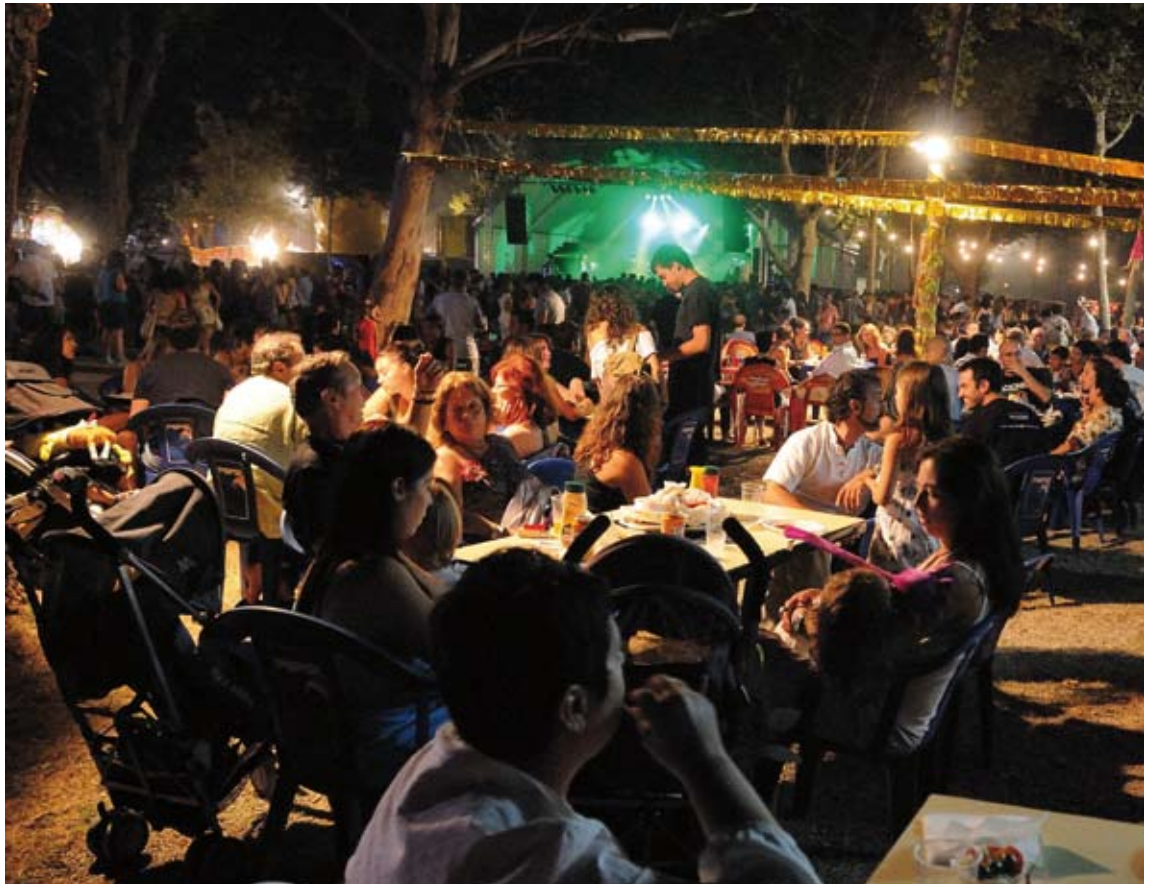
BARRAQUES. S'inauguraran avui al recinte firal i hi seran fins al proper diumenge, 19 d'agost

Esport al matí, i és que a les 11 h, als espigons de la riera Ginjolars, començarà la XXVII Traversia Local de Natació "Trofeu Enric Badosa", un clàssic de les festes. A les 12.30 h, a l'espigó de la riera Ginjolars, tindrà lloc la tradicional festa de les Cucanyes; i a les 13 h, davant de la platja de la Punta, la tradicional empaitada d'ànecs. A la tarda, a les 18 h a la plaça de Catalunya, refrescament per combatre la calor amb la festa de l'espuma, titulada "Bugada en sol major", a càrrec de la cia. Els Farsants. A les 19 h, a la plaça de l'Església es farà la Missa Internacional Oikumene;