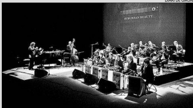
La formació que actua aquesta nit a la platja Gran.

► El 15è Festival Nits de Jazz a Platja d'Aro segueix aquesta nit amb l'actuació de la Big Band Jazz Maresme & Marian Barahona. El concert d'avui començarà a les 23 hores i tindrà lloc, com és costum a la Platja Gran (zona de Cavall Bernat) de la població del Baix Empordà. La formació del Maresme compleix set anys d'existència, període en el que