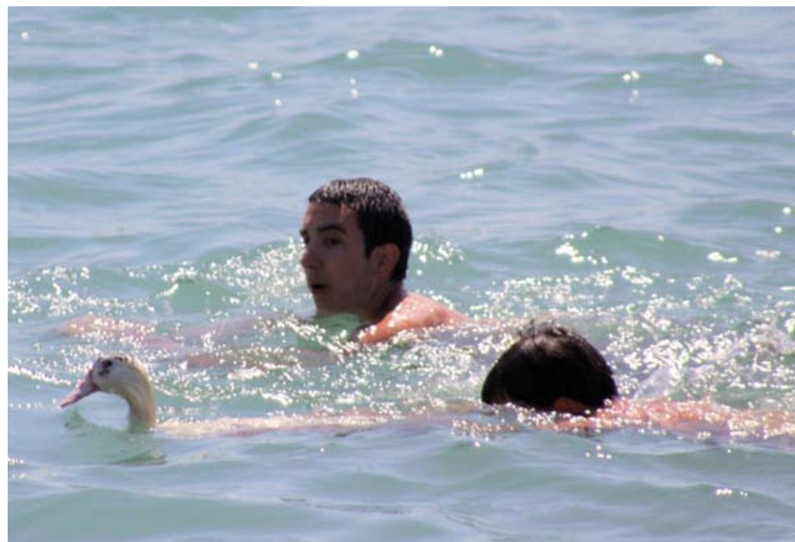
EMPAITADA D'ÀNECS. Tindrà lloc a la platja de la Punta el diumenge 12 d'agost a les 13.30 h