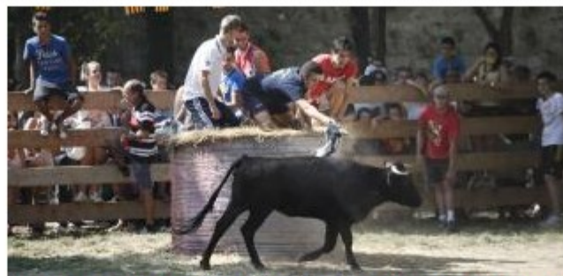
El correbou es trasllada a l'antic càmping Bahía per donar més seguretat i comoditat als animals.