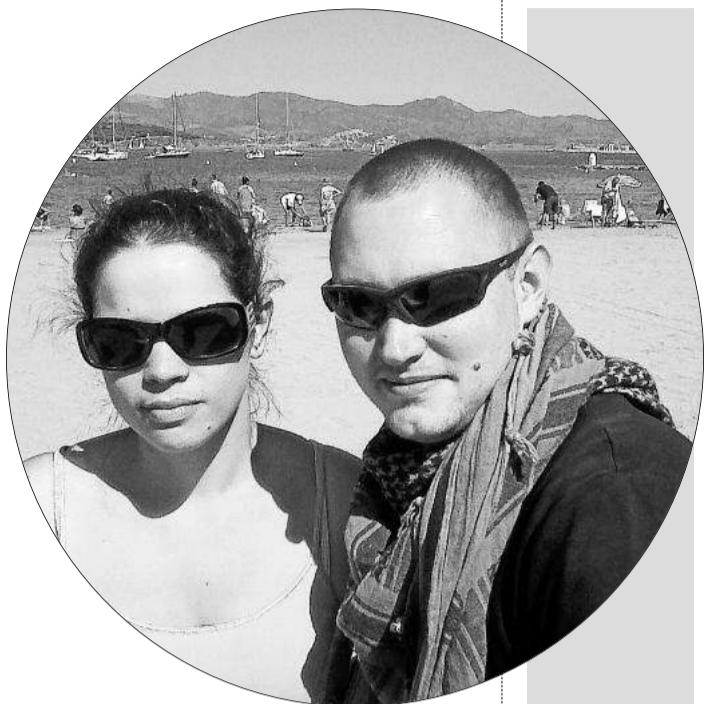
PAÍS: FRANÇA ESTIU EGEN A: EL PORT DE LA SELVA