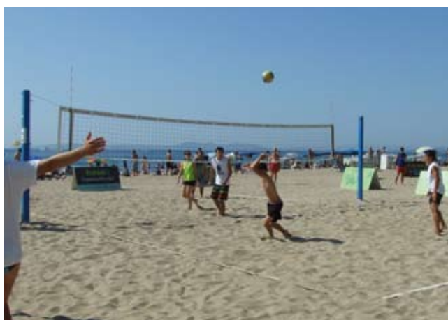
VÒLEI PLATJA. El dissabte 18 se celebrarà el tercer torneig

C/ Gravina, 25-29 17480 Roses Tel./Fax 972151722 gpalou@hotm.com