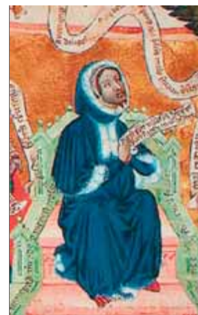
Eiximenis va néixer a Girona el segle XIV