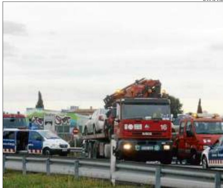
Els serveis d'emergència retirant els vehicles accidentats.

► El trànsit es va desviar per l'antiga carretera, on es van registrar retencions de tres quilòmetres