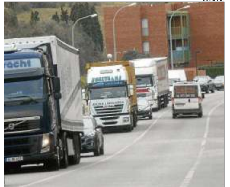
Cues a l'antiga N-II d'accés a Figueres a dos quarts de dues del migdia.

Els ferits que, segons el Servei Català de Trànsit, no presentaven ferides de gravetat, van ser traslladats al centre hospitalari per tal de ser atesos. L'accident es va situar just en un punt amb molt de trànsit, entre el tram que porta a la Jonquera i l'autopista, i a pocs metres del cinturó de ronda. La via inicialment es va tallar en els dos sentits però es van començar a