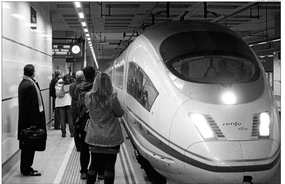
La FOEG recorda que el primer TAV arriba a Madrid a les 11.10 i que no va bé per als treballadors.

ganitzacions Empresariales de Girona (FOEG), que ja havia donat el seu suport a la iniciativa d'aquest grup d'inversors, tot i que ahir va matisar que no ho feia amb cap contribució econòmica. Segons van recordar des de la Federació, el TAV de Girona a Madrid opera amb «horaris poc funcionals». Així, van afirmar que l'avantatge que pot oferir el vol és una connexió amb sortida de Girona a primera hora en direcció a Madrid, amb arribada coincidint amb l'inici de la jornada laboral, i de l'al-