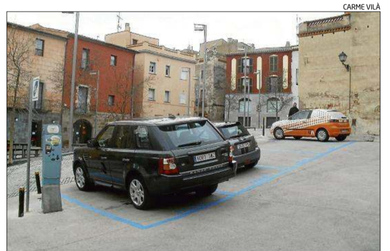
Plaça entre el carrer de la Moneda i el Sant Pere Més Baix.

Les ajudes estan cofinançades entre el Servei d'Ocupació de Catalunya i el Fons Social Europeu.