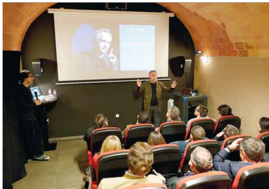
Ferran Adrià en la conferència que va fer a l'Espai Armengol de Vilajuïga per parlar del projecte de la fundació ■ EL PUNT AVUI

Amb el llum verd d'Urbanisme, el cuiner de renom mundial té el camí aplanat per poder inaugurar El Bulli Foundation el 2014. ■