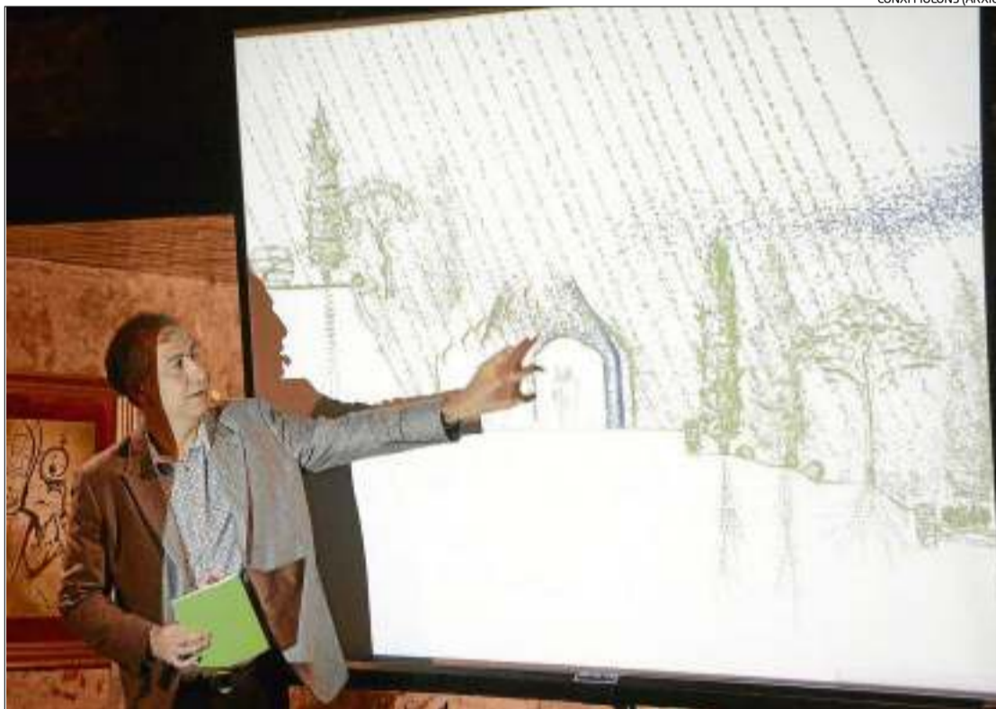
L'arquitecte Ruiz-Geli presentant el projecte de Bulli Foundation a Figueres.

La Comissió d'Urbanisme també va aprovar definitivament la creació d'una nova sala de 144 metres quadrats al restaurant Celler de Can Roca per fer-hi un menjador exclusiu per a 12 comensals. Aquest espai ocuparà el soterrani i part de la planta baixa i s'ha aprovat pel seu interès públic ja que el restaurant dels germans Roca ja havia assolit el límit d'edificabilitat. Els comensals de la nova sala podran combinar la gastronomia amb altres sentits com els de l'olfacte o l'oida.