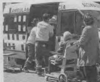
El transport sanitari no urgent deixa de ser gratuït. PERE TORRERA

El pagament que haurien d'assumir els malalts crònics oscil·la entre els 6 i els 60 euros al mes en funció dels seus ingressos. Els consellers de Salut de les diferents comunitats autònomes van demanar ahir a la ministra de Sanitat, Ana Mato, que s'exclouï d'aquest copagament del transport no urgent els malalts de càncer i els que necessiten diàlisi, però no van ser escoltats. —