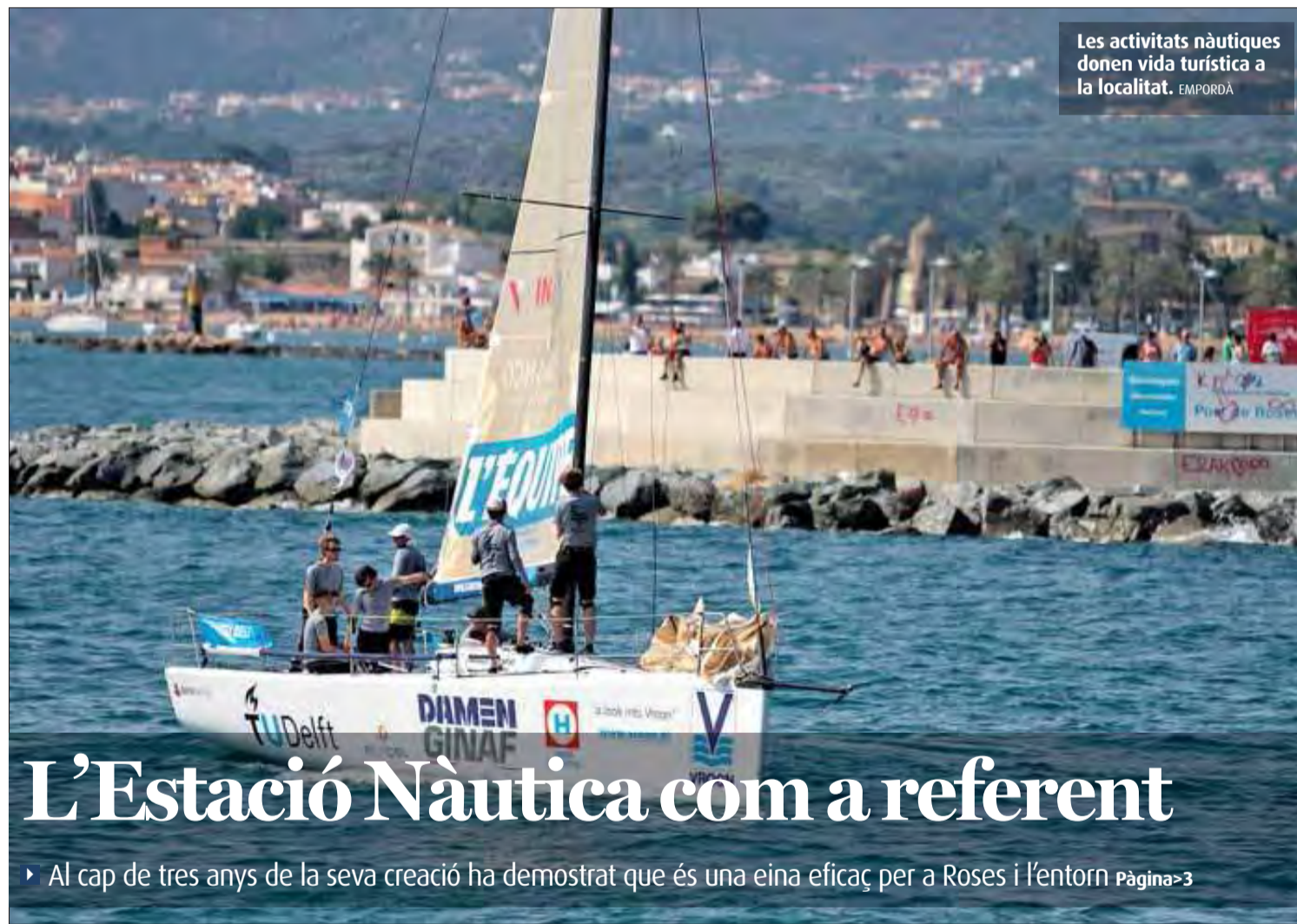
Les activitats nàutiques donen vida turística a la localitat. EMPORDÀ

■ S'instal·laran a l'avinguda de Rhode i l'equip de govern vol que ja estiguin actius aquest estiu Pàg>2