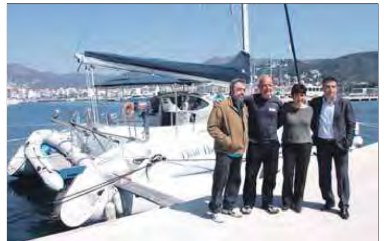
Els impulsors de l'acord amb el catamarà darrere. EMPORDÀ

Entre les accions que durà a terme el catamarà es troba la seva participació en diferents esdeveniments nàutics que se celebraran a Roses durant aquest any 2013. D'altra banda, el Projecte Ninam desenvoluparà un programa d'activitats durant aquest mateix any que inclourà sortides en vaixell, una conferència sobre medi ambient, biodiversitat i conductes sostenibles en l'àrea d'influència de Roses i un taller mediambiental que constarà de quatre sortides ludicoformatives en vaixell i una jornada formativa sobre medi ambient destinada al jovent de Roses.