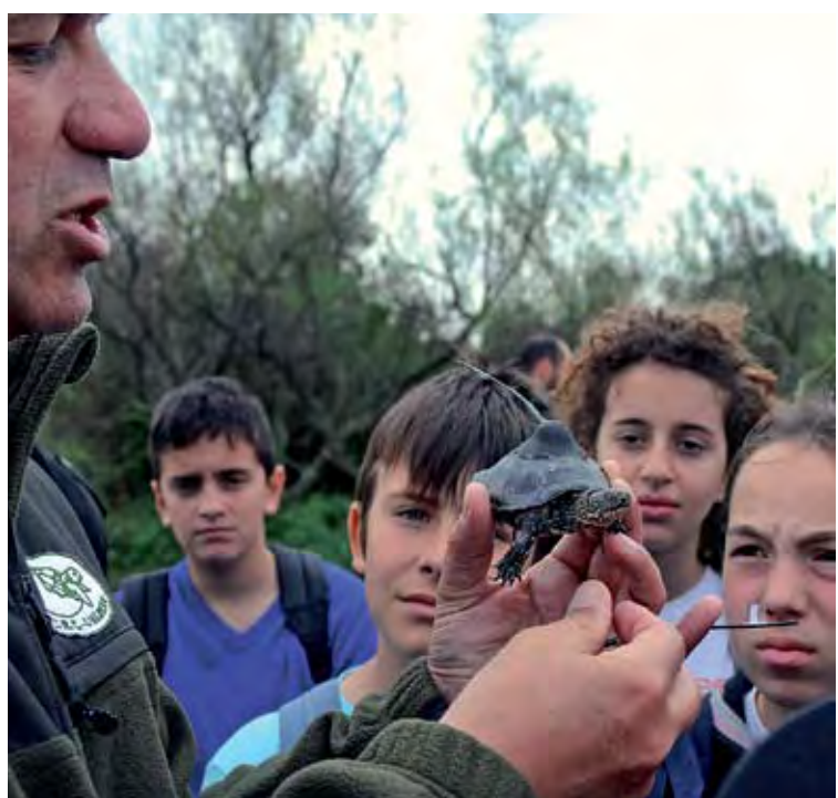
ALLIBERAMENT. Alumnes dels Vicenç Vives de Roses en van ser testimonis

Durant l'acció de divendres, els alumnes del Vicenç Vives de Roses van poder fer un autèntic treball de camp fora de l'aula. ■