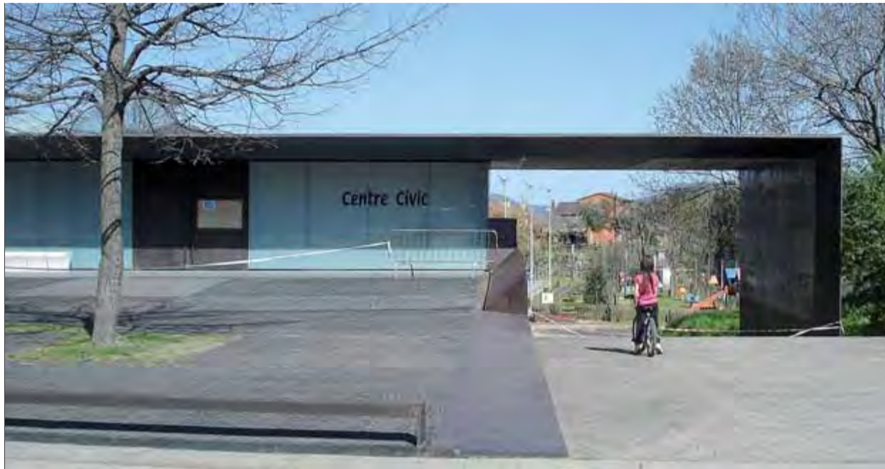
El centre cívic amb l'accés tancat, després que caigués una placa metàl·lica, fa uns dies ■ T.S.