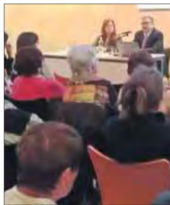
Imatge de la xerrada.