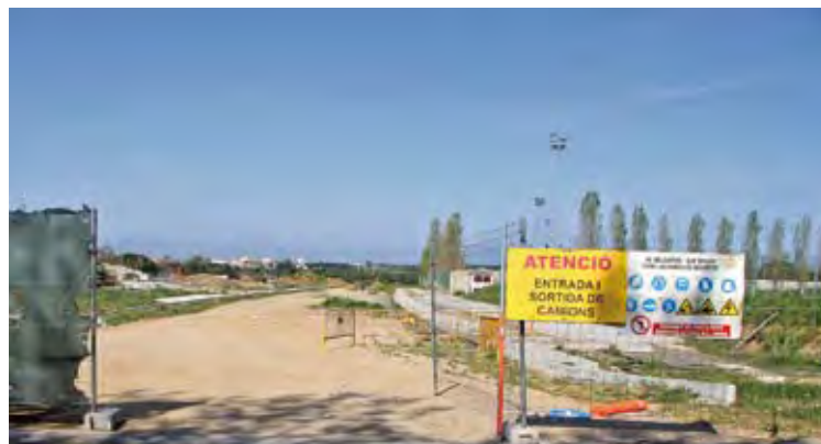
TREBALLS ENCALLATS. L'obra s'havia iniciat al maig del 2011