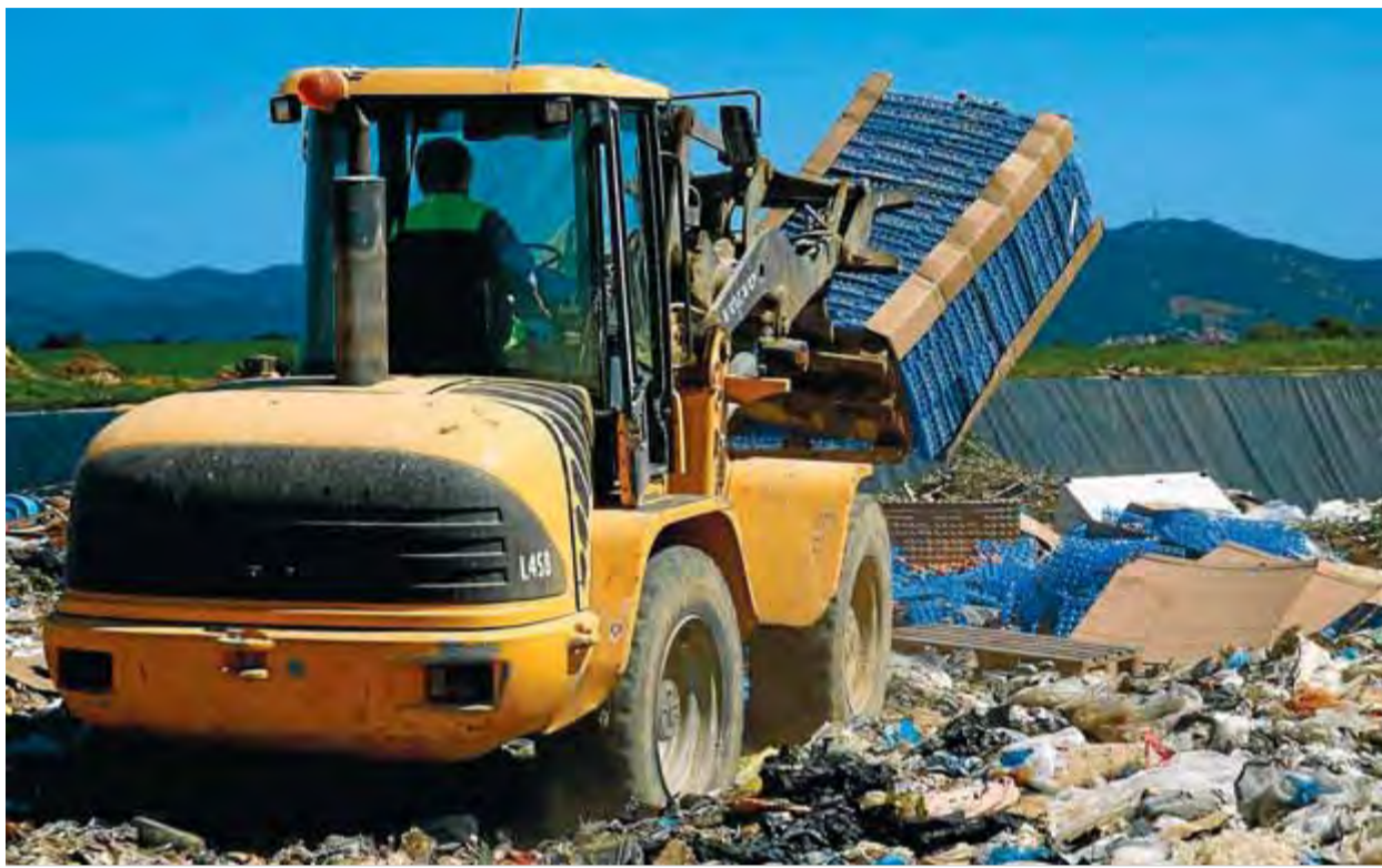
Una màquina va anar llençant els ous a l'abocador ahir durant tot el matí