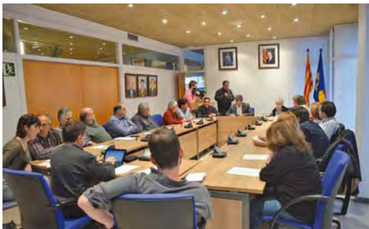
CONSELL DE SALUT. Amb els alcaldes dels 9 municipis de l'ABS de l'Escala

Els alcaldes de l'Escala, Bellcaire d'Empordà, Albons, Viladamat, Ventalló, l'Armentera, Torroella de Fluvià, Sant Pere Pescador i Vilamacolum es van reunir hores després de conèixer-se la notícia per fer-ne una valoració. Els municipis han reclamat al conseller de Salut, Boi Ruiz, que els tingui en compte a l'hora de decidir la fórmula de gestió del CAP i els set consultoris mèdics. Els alcaldes han celebrat que l'Or-