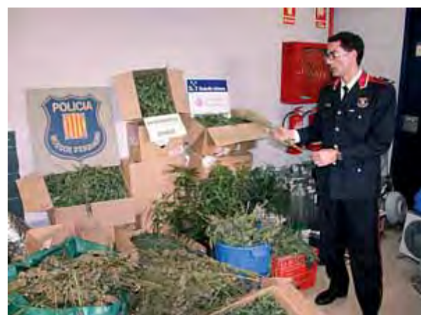
L'inspector Alfons Sánchez, cap dels Mossos de Figueres, ensenya part del material comissat

só per tràfic de drogues. També hi ha nou imputats més. Alguns d'ells la setmana passada van ocupar una filera de cases a Vilafranca. Divendres també va ser detingut un veí del barri que va apedregar un cotxe dels Mossos que participava en l'operació. ■