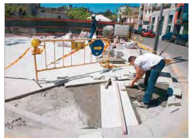
Una imatge de les obres a la plaça de la Coma de Cassà de la Selva, dimecres passat. A la dreta, el Centre Recreatiu ■ J.S.

Els treballs, inclosos els de dins i fora de l'espai de vianants, costaran 35.000 euros. ■