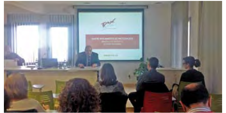
CONFERÈNCIA. Una imatge de la xerrada que va organitzar TAX