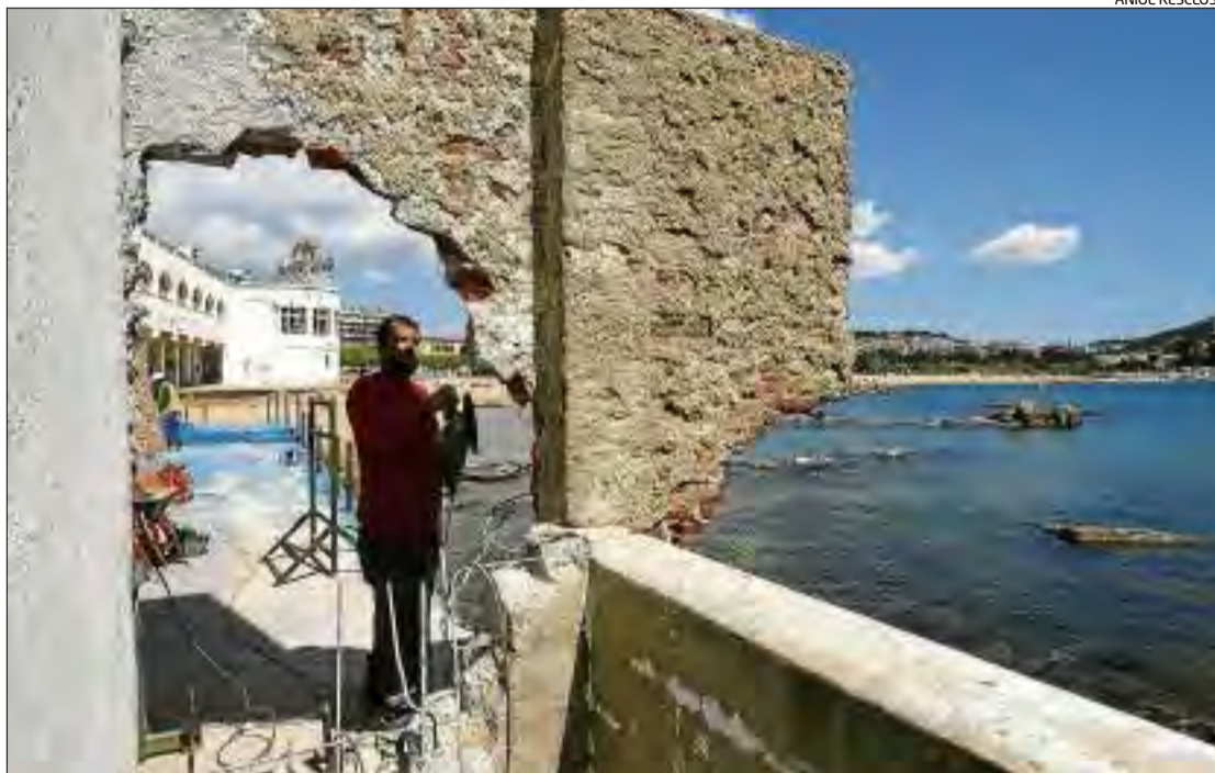
Un moment de l'enderroc del mur, vist des de l'interior de la concessió del Club de Mar.

En tot cas, i malgrat l'enderroc del mur que ha executat la Generalitat subsidiàriament, el pronunciament definitiu està pen-