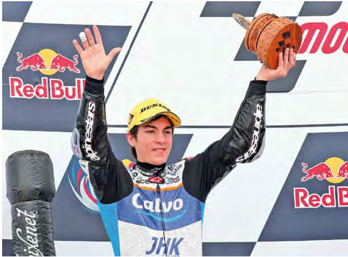
REACCIÓ. Maverick Viñales va cometre una errada al principi de la segona cursa, però es va refer i va pujar al podi

Maverick Viñales va muntar un neumàtic nou per escapar-se, però va cometre una errada que el