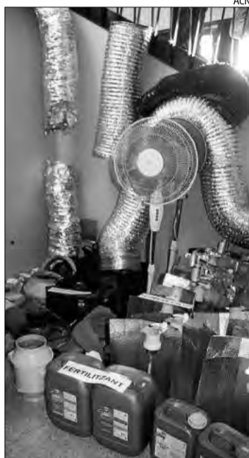
Alguns dels materials utilitzats.

Una xarxa que es dedicava a cultivar marihuana en pisos i que venien, possiblement, al potencial client francès. D'això en tenia constància la policia i, per això, es va posar en marxa un operatiu dijous passat al vespre que va durar fins a les sis del matí de dissabte. El que van trobar, en paraules del cap de la comissaria de Figueres Alfons Sánchez, no té precedents a la demarcació. I és que en només vuit pisos -que havien convertit en autèntics habitatges dedicats al cultiu massiu- hi havia fins a 3.000 plantes. Però no només això. Davant dels controls i l'operatiu, alguns dels implicats van intentar fugir enduint-se la droga en vehicles. Els agents van tancar els accessos i en diversos controls van trobar 160 plantes més en tres furgonetes. Els cinc detinguts pel cas han ingressat a presó