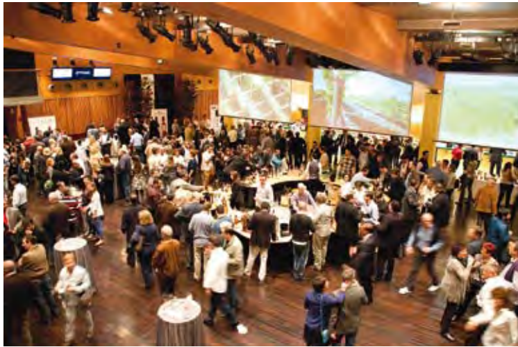
TERCERA EDICIÓ. Perelada Comercial va estrenar nova ubicació PERELADA COMERCIAL

Entre les novetats destaquen els nous Castell Peralada Jardins, dos vins joves amb complexitat de matisos florals que pretenen il·lustrar aromàticament l'essència dels jardins del castell. Els dos vins han estat elaborats amb macabeu i sauvignon blanc (Jardins Blanc 2012) i garnatxa i merlot (Jardins Rosé 2012).