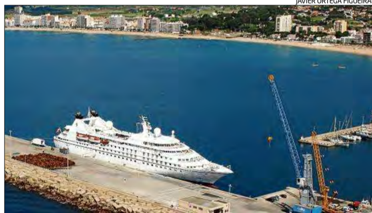
El «Seabourn Legend», en una visita anterior al port palamosí.

Els problemes econòmics de Seabourn van ser aprofitats per Carni-