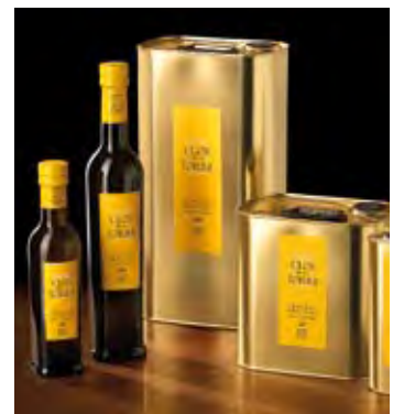
CLOS DE LA TORRE

L'oli d'oliva verge extra Clos de la Torre, entre els millors del món