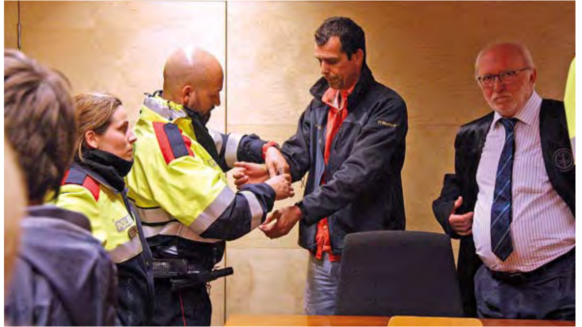
ÚLTIMA VISTA. El fiscal i les dues acusacions han demanat que el condemni a 23 anys de presó, i la defensa recorrerà