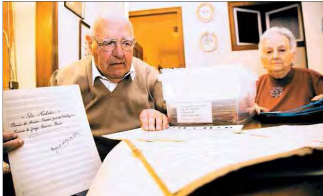
MONSENY EMPORDÀ/FONS ARXIU CERVERA

Els esdeveniments que en aquests propers mesos s'aniran succeint, no han sorgit, doncs, espontàniament, sinó que han estat fruit d'altres passes prèvies fetes per la família al llarg de molts anys. D'entre aquestes destaca, per la seva importància, la cele-