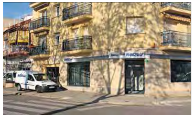
Des de MRW us ofereixen tot tipus de missatgeria. EMPORDÀ

Els seus responsables volen donar a conèixer que MRW és molt més que una empresa de paqueteria i que, entre d'altres, també ofereix els següents serveis: recollida d'oblids en hotels o particulars, gestions als consolat, recollida de medicaments a les farmàcies o hospitals aportant còpia de la recepta i auto-