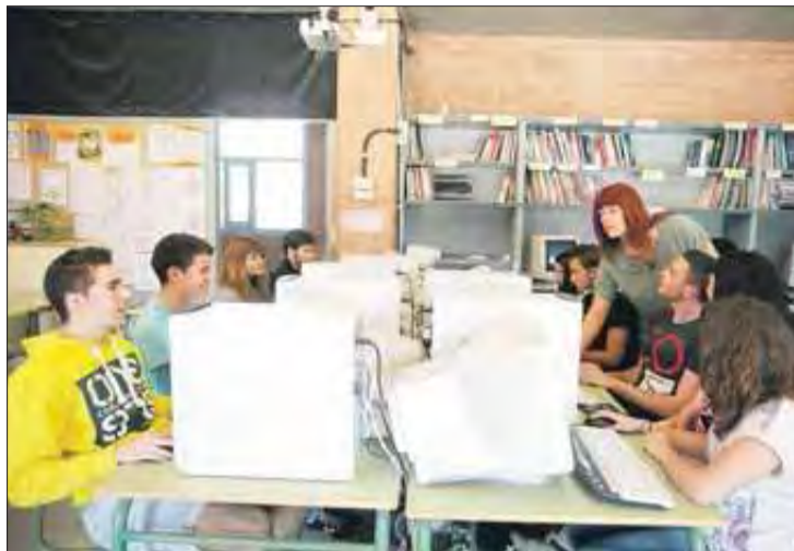
Alumnes d'un dels cicles formatius de l'Institut Cap Norfeu. MONTSENY EMPORDÀ

Alhora podrem saber si la nostra experiència laboral es pot reconèixer acadèmicament per con-