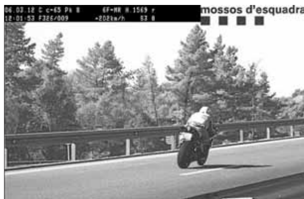
La imatge que va captar el radar dels Mossos

Els Mossos d'Esquadra van enxampar un motorista de Palafrugell que circulava a 202 quilòmetres per hora per la carretera C-65, a Llagostera. Els fets van tenir lloc quan els Mossos d'Esquadra de trànsit estaven realitzant un control de velocitat al punt quilomètric 8 de la C-65. Els agents van atu-