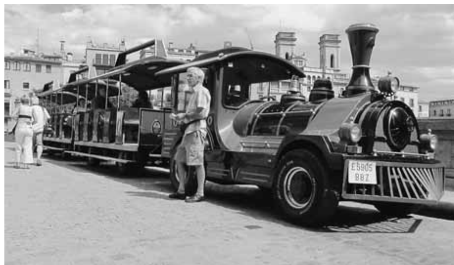
El tren 'Gerió', un clàssic de la ciutat de Girona, parat al pont de Pedra

En paral·lel, el govern municipal ha refet el plec de condicions per al nou concurs que permetrà la concessió del servei i del concurs. Aquest procés és en la seva fase final, però tot indica que el cànon per al servei de trenet turístic podria voltar els 40.000 euros l'any, un cop s'han analitzat els casos d'altres municipis gironins i catalans que tenen aquest tipus de servei. Això seria