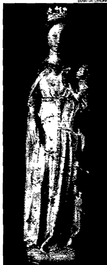
La verge que ha estat robada.