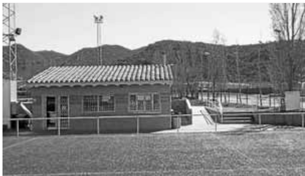
EL PUNT AVUI