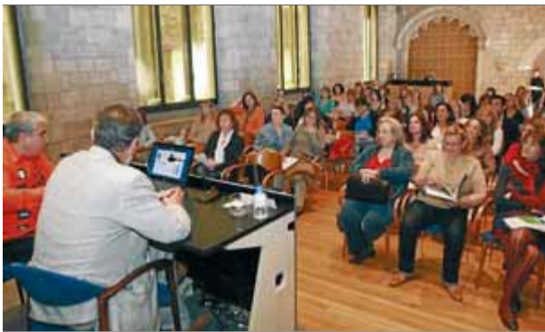
Dos dels ponents que ahir van participar en la jornada sobre riscos laborals, a la Fontana d'Or