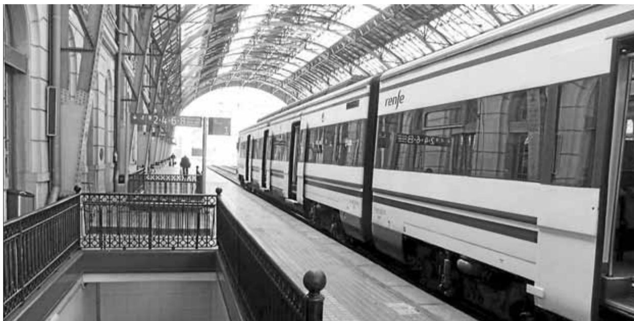
Un tren a l'estació de Portbou, la setmana passada

L'augment de temps de viatge de la línia de tren entre Portbou i Barcelona va ser un dels temes que van provocar la creació de la plataforma d'usuaris de Renfe a les comarques gironines, que el 2009 van veure com això coincidia amb un augment del preu del bitllet i s'afegia a altres deficiències en el servei. Segons les previsions inicials, aquesta primavera ja s'hauria d'haver pogut començar a recuperar temps de trajecte, però el retard en alguns dels trams del TAV ho ha ajornat com a mínim fins a final d'any. A final de març, la plataforma va enviar una carta al director general de Transports i Mobilitat de la Generalitat, Ricard Font, en què li demanava informació sobre diversos aspectes de la línia ferroviària. En la posterior resposta, Font explica: "És possible que aquest mateix any ja puguem veure