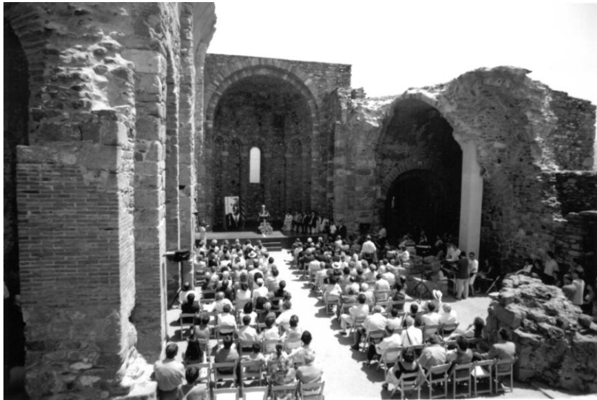
Perspectiva de l'església durant l'homenatge