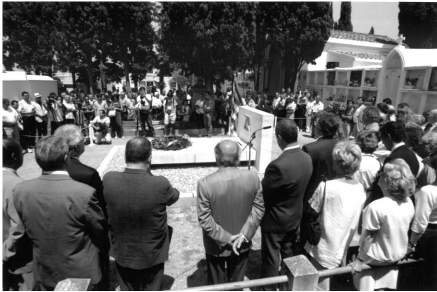
Instantània d'un moment de silenci