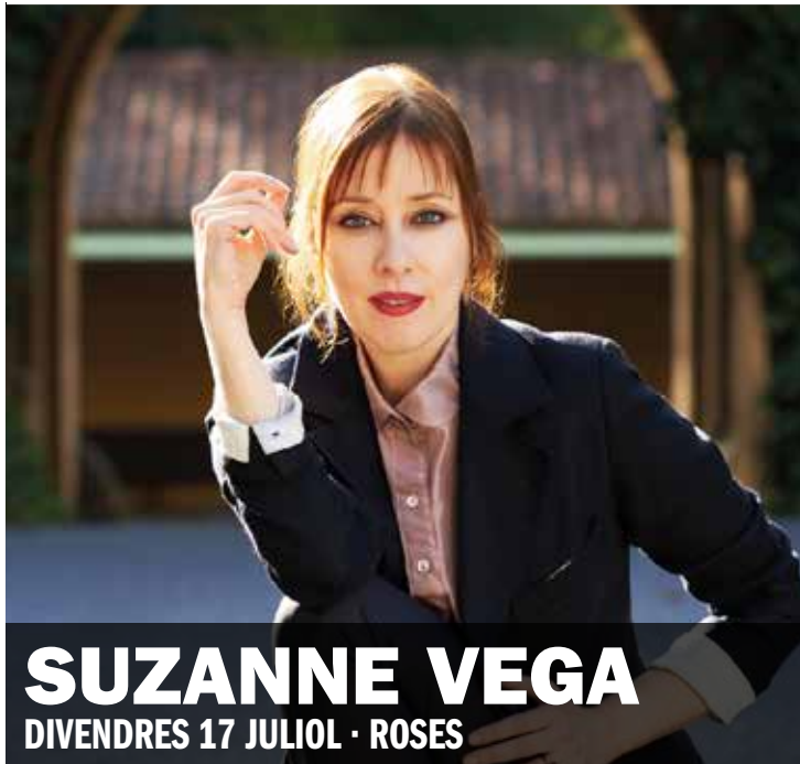
SUZANNE VEGA DIVENDRES 17 JULIOL · ROSES

JULIOL 2015 / INFORMACIÓ I VENDA D'ENTRADES A: www.sonsdelmon.cat