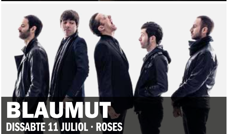
BLAUMUT DISSABTE 11 JULIOL · ROSES