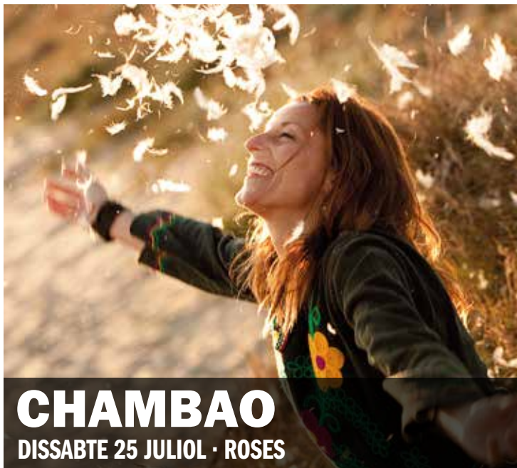
CHAMBAO DISSABTE 25 JULIOL · ROSES