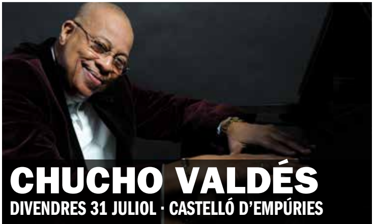
CHUCHO VALDÉS DIVENDRES 31 JULIOL · CASTELLÓ D'EMPÚRIES